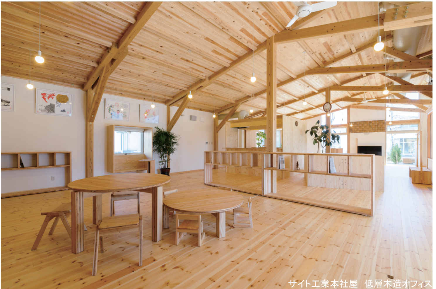
サイト工業本社屋 低層木造オフィス